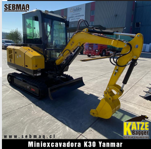
Miniexcavadora K30 Yanmar