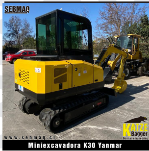
Miniexcavadora K30 Yanmar